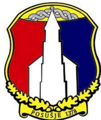
Grb Općine Posušje