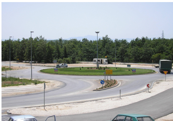
Kružni tok Ričina

U posljednje vrijeme općina Posušje je prepoznala važnost prometnica, te u skladu sa svojim mogućnostima ulaže sve veće i veće napore na izgradnji prometne infrastrukture, kao i na sanaciji i proširenju postojeće.