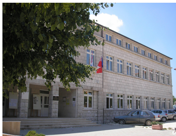
Zgrada Općine Posušje