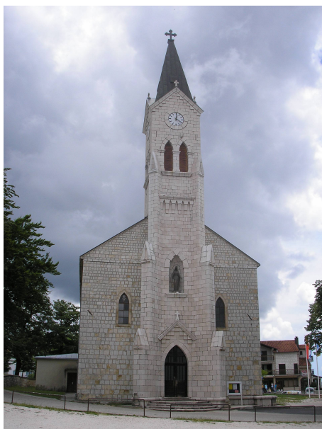
Crkva Bezgrješnog začeća B.D.M. Posušje