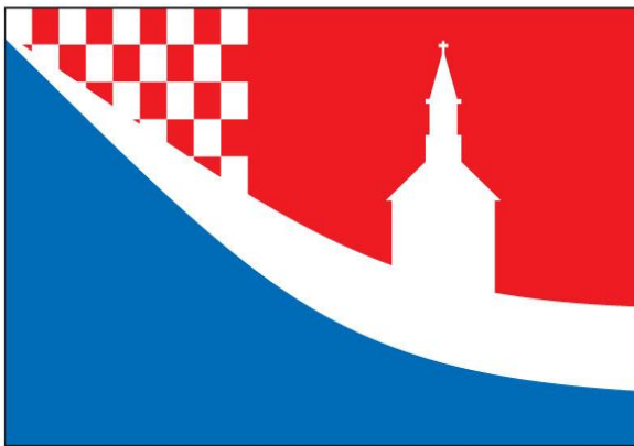
Zastava Općine Posušje